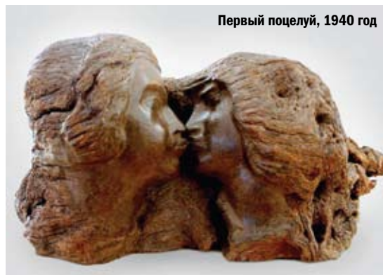
Первый поцелуй, 1940 год