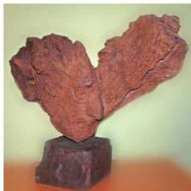
Скульптурный портрет Бартоломео Митре, 1933 год

Здесь же в Аргентине он впервые в истории скульптуры использовал южноамериканские породы деревьев. Надо отметить, что в качестве материала Эрзя предпочитал именно древесину. Многие пластические приемы работы с ней были подсказаны мастеру деталями эрзянских изб, затейливыми орнаментами деревянных долбленых традиционных сундуков-ларей, предметов домашней утвари. Особо ценные виды деревьев – альгарробо, урундай, кебрачо – добывались в аргентинской провинции Мисьонес. Эрзя неоднократно бывал там и возвра-