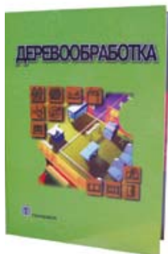
Деревообработка Сборник под ред. В. Нуча

В книге описаны принципы классификации и требования, предъявляемые к дереворежущему инструменту, геометрия лезвия и характеристика инструментальных материалов, освещены вопросы износа и надежности оборудования. Подробно изложены современные конструкции пил, фрез, ножей, сверл, токарных резцов, долбежного и абразивного инструмента, освещена методика выбора основных параметров инструментов, рациональные методы подготовки к работе и эксплуатации. Кроме того, в книге рассмотрены вопросы организации инструментального хозяйства предприятия. Особое внимание уделено объективной количественной оценке принимаемых технических решений. Книга предназначена для руководителей, технологов и работников инструментальной службы лесопильных и деревообрабатывающих предприятий, специалистов по продажам деревообрабатывающего инструмента, студентам лесотехнических вузов и колледжей.