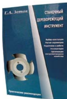
Станочный дереворежущий инструмент Г.А. Зотов

В книге даны материалы экономического характера, позволяющие рассчитать возможные затраты на производство различного вида полуфабрикатов из клееной и цельной древесины. Книга представляет интерес для широкого круга инженерно-технических работников лесопильно-деревообрабатывающих предприятий, проектных и экономических организаций, студентов лесотехнических вузов и колледжей.